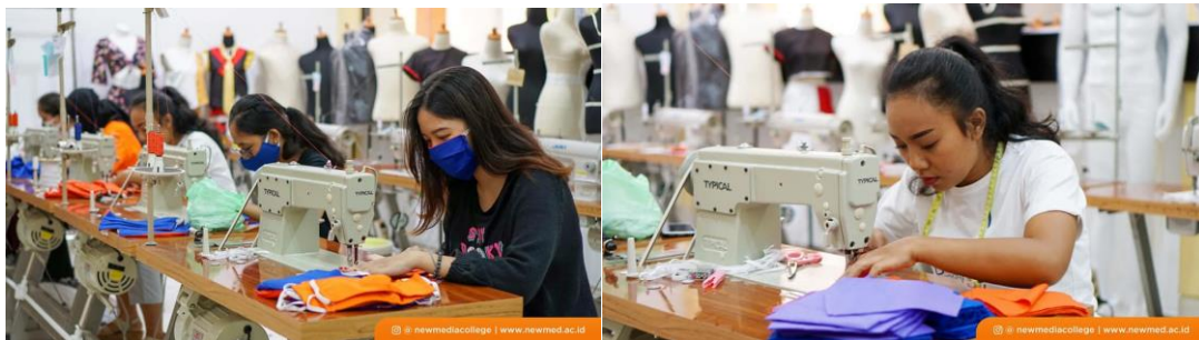
Gambar 2 Proses jahit masker