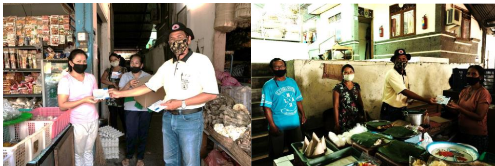
Gambar 4 Pembagian Masker oleh Kepala Pasar Yadnya