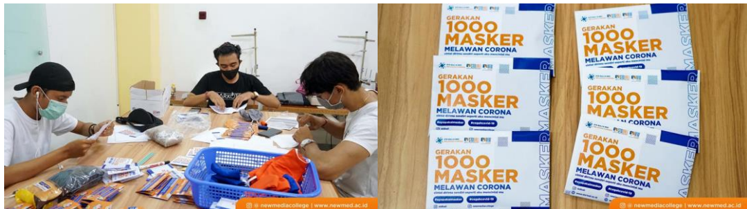
Gambar 2 Proses Pengemasan Masker