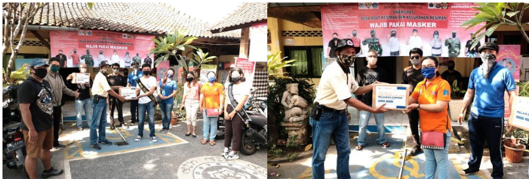
Gambar 3 Penyerahan Masker secara Simbolis

Beberapa kendala yang dihadapi pada saat kegiatan ini diantaranya: (1) Adanya keterbatasan dalam jumlah mesin jahit yang digunakan untuk menjahit Masker di kampus STD Bali sehingga mahasiswa menjahit di rumah masing – masing. (2) Adanya wabah Covid 19 yang menyebabkan proses menjahit di kampus sedikit terhambat karena harus menerapkan Social Distancing. (3) Kegiatan pembagian masker tidak bisa diserahkan secara langsung kepada pedagang di Pasar Yadnya untuk menghindari kerumunan masyarakat, sehingga penyerahan dilaksanakan secara simbolis kepada Kepala Pasar Yadnya.