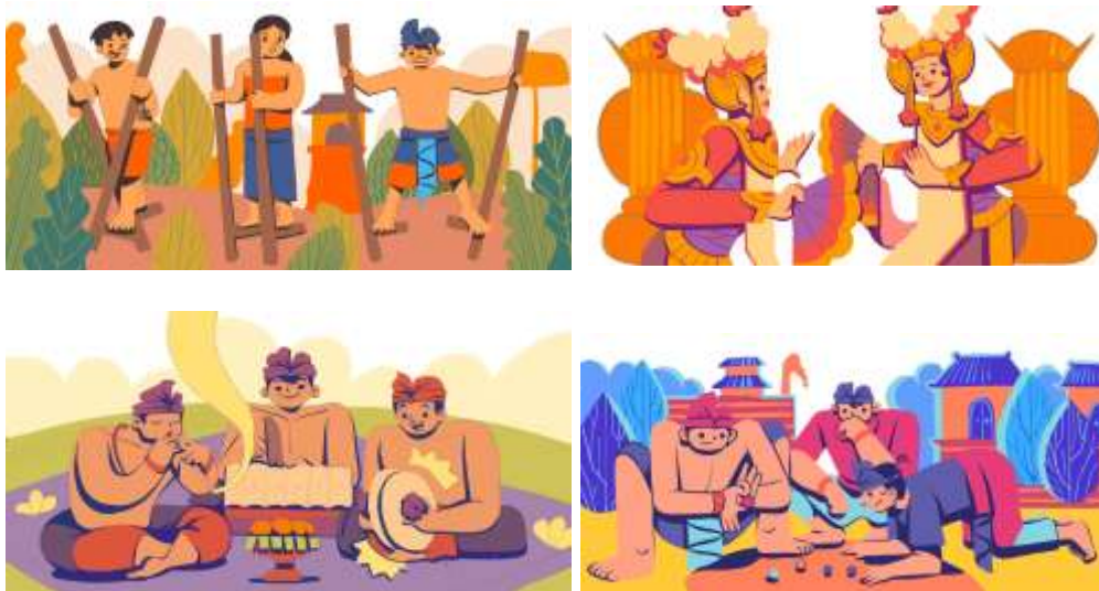
Gambar 3. Desain Mural