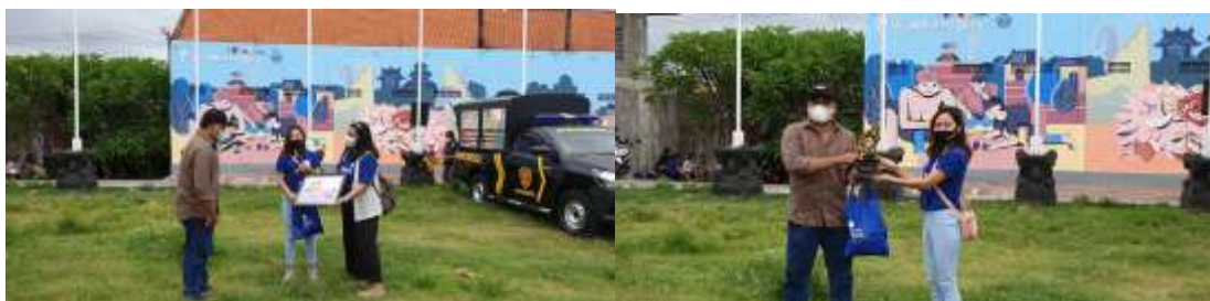
Gambar 5. Serah Terima Hasil Mural

Beberapa kendala yang dihadapi pada saat pengabdian masyarakat pembuatan mural ini diantaranya nya: masalah cuaca yang sudah masuk musim hujan sehingga pada saat pengerjaan sering tertunda karena turun hujan. Adanya wabah Covid 19 yang menyebabkan peserta yang terlibat dalam pengerjaan harus dibatasi perhari nya agar tidak menimbulkan kerumunan sehingga pengerjaan nya menjadi lebih lama.