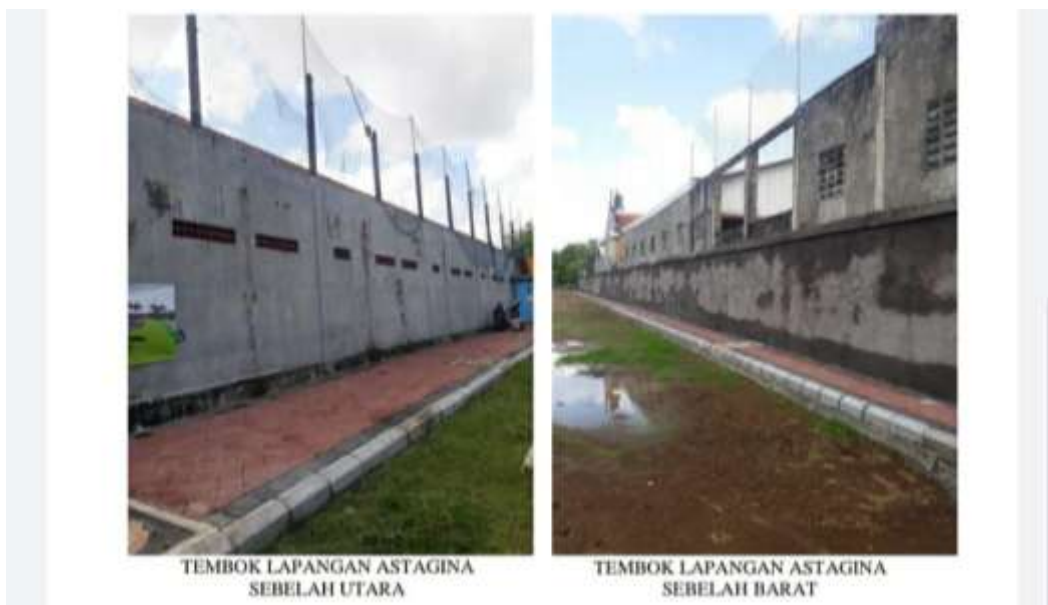
Gambar 2 Rencana Lokasi Mural