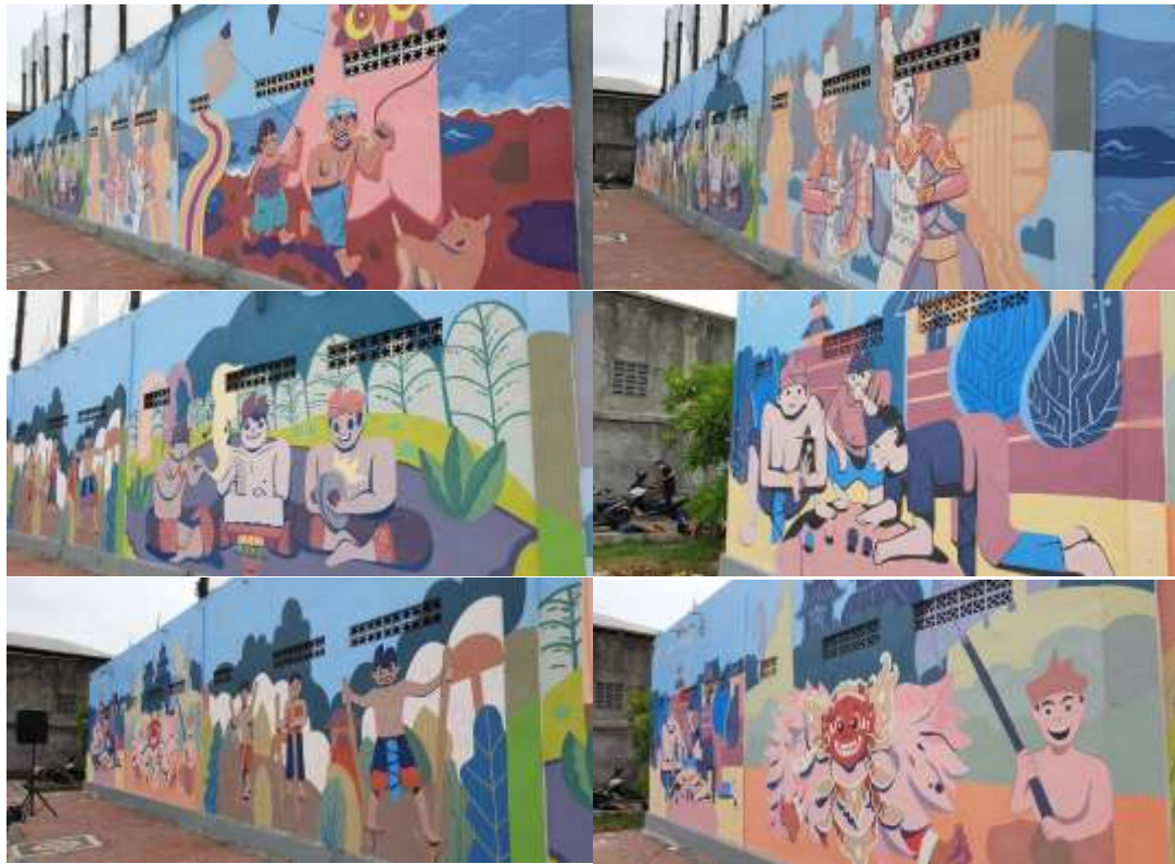
Gambar 6. Hasil Kegiatan Mural