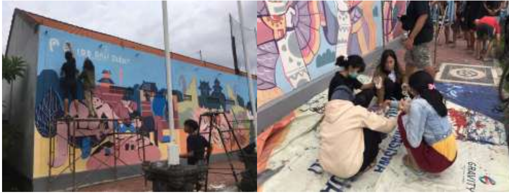
Gambar 4. Proses Pengerjaan Mural